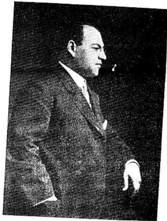
1908 - 1910. Encargado de Negocios del Uruguay en los Estados Unidos.