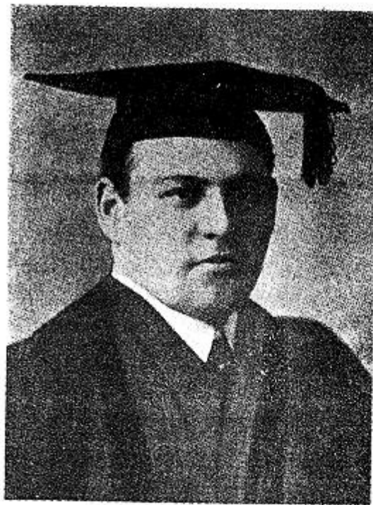
En el traje del grado universitario: Master of Arts (Maestro en artes), y de candidato al doctorado en Leyes y Filosofía, Universidad George Washington, Washington, D. C. (E. E. U. U.) en 1909.